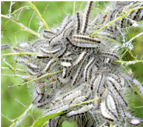
Raupen des Eichenprozessionsspinners.

Bei Waldschutz Schweiz sind in den letzten Wochen deutlich mehr Beratungsanfragen und Befallsmeldungen zum Eichenprozessionsspinner eingegangen als in den Vorjahren. Dabei waren einerseits gut besonnte Eichen im Siedlungsraum oder entlang von Waldrändern betroffen, erstmals wurde in der Ostschweiz aber auch ein sich über mehrere Hektaren ausdehnender Befall in einem Eichenwald festgestellt. Während Massenvermehrungen kann der Eichenprozessionsspinner seine Wirtsbäume völlig entlauben. Die Schmetterlingsart stellt zudem ein Gesundheitsrisiko dar, da die Brennhaare ihrer Raupen bei Menschen und Tieren allergische Reaktionen auslösen können.