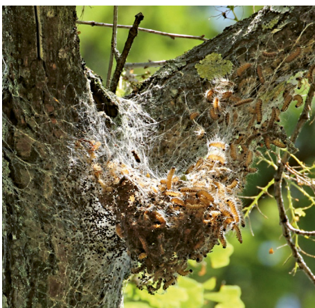
Gespinstnest des Eichenprozessionsspinners.