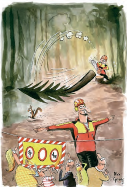
Wald Schweiz, Verband der Waldeigentümer. Illustration: Max Spring