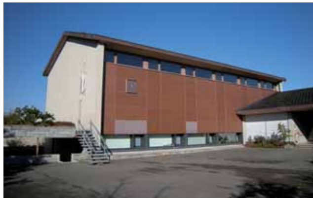
Turnhalle Zielacker, Kleinandelfingen