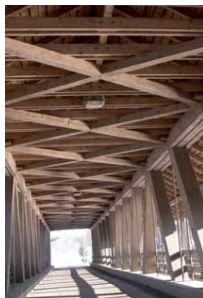
Thurbrücke bei Alten

Der Vorstand des Gemeindepräsidentenverbandes Bezirk Andelfingen (GPV) hat eine einheitliche Empfehlung für den Bezirk Andelfingen erarbeitet. Der Vorschlag umfasst eine fallabhängige Entschädigung von Fr. 650 pro Fall. Auf der Basis der Erfahrungswerte wird die neue Regelung in unserer Gemeinde keine erheblichen Mehrkosten zur Folge haben.