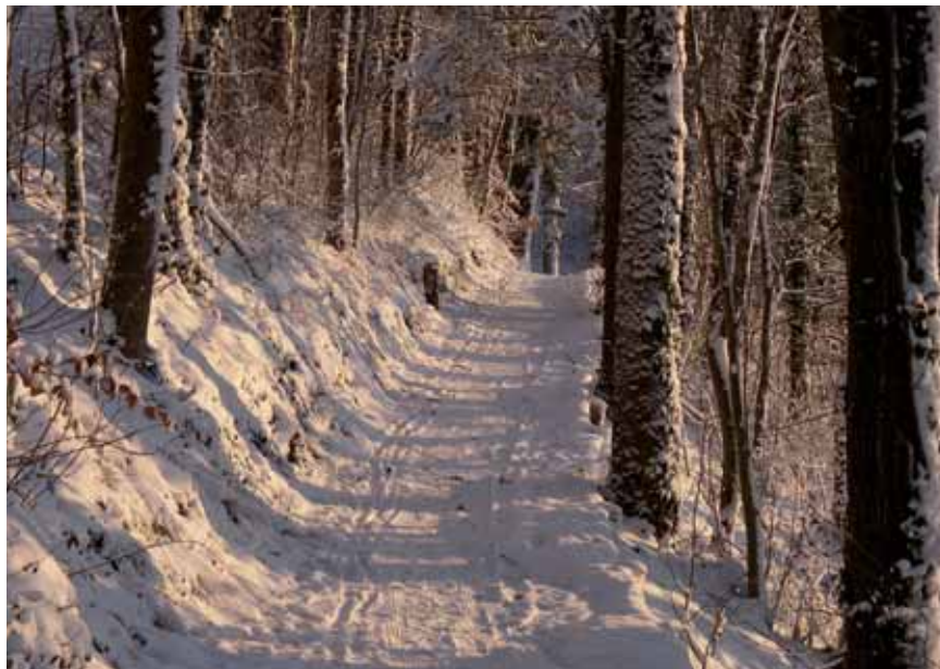
Fussweg zum Grillenpark

Hundekotsäcklein erhalten Sie gratis auf der Gemeindekanzlei.