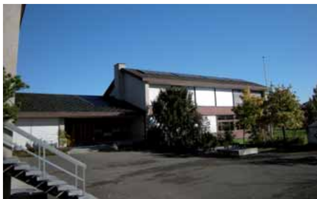
Klassentrakt Süd Zielacker, Kleinandelfingen

Weiter wird der Turnhallenboden ersetzt und die Spielgeräte werden erneuert oder angepasst. Auch der Geräteraum wird vergrössert und umgestaltet.